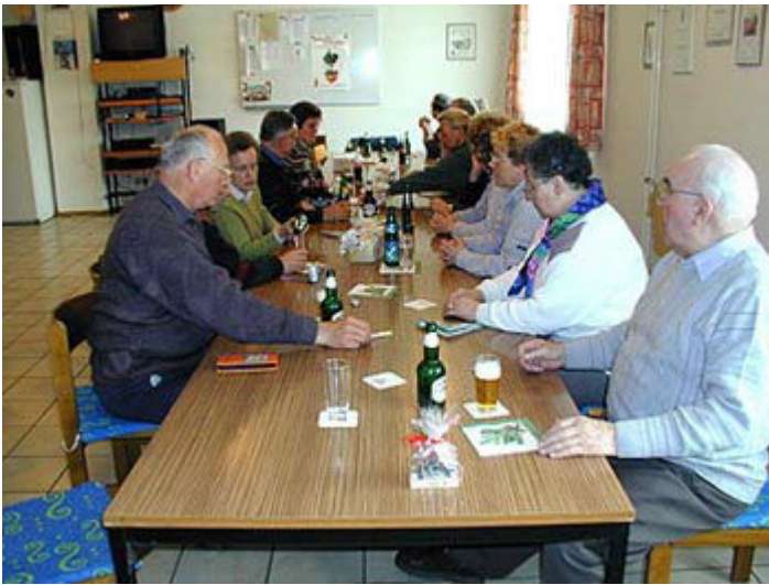
anschließend bei den Kameraden in Opperhausen...