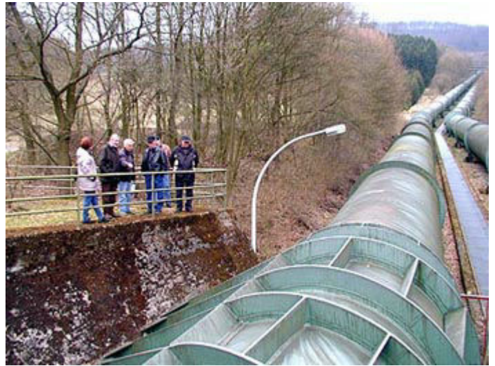
die mächtigen Rohrleitungen