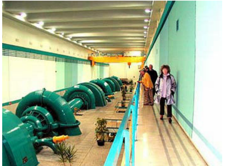
...und so sieht es in tatsächlich aus