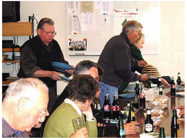
...hier wurden wir köstlich verpflegt.