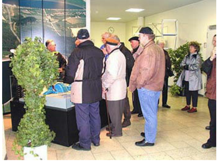
Vorführung der Abläufe am Modell