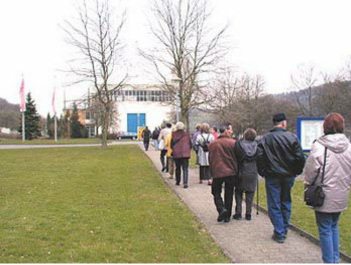
das Wasserkraftwerk an der Leine